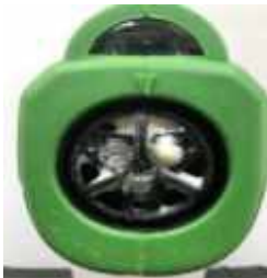
Buse N° 1 (Sale)

Pour réduire le risque de blocage, nous recommandons qu'après tous les deux ou trois jours d'utilisation, de pulvériser un réservoir d'eau dans l'unité pour éliminer toute accumulation de produit chimique résiduel qui pourrait s'être produite.