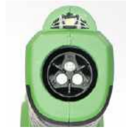
Buse N° 2 (Propre)